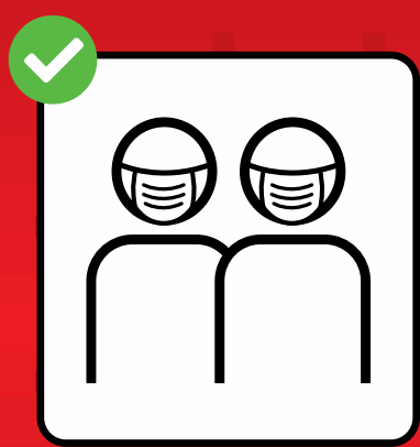
Masken tragen, wenn Abstand nicht möglich ist.