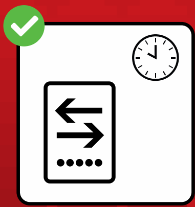
Billett online kaufen.